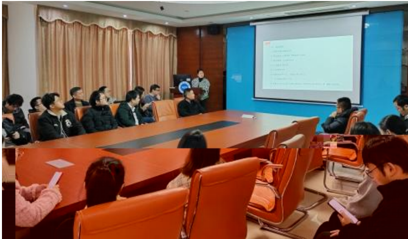
图 员工专业技能培训

，公 促 发 和 才 方 得 成 。 过 创 的 和 ， 不 动 公 的 持 成长， 工 供 的发 机会。 过 供多 化的 和发 ， “ 队 共 ” 等 活动 ( )， 帮 工 ( 技 和管 ； 并 的 和 规划， 工的 合 和 ， 包 导 发 计划、技 技 及 部 等， 地促 工的 方 发 。