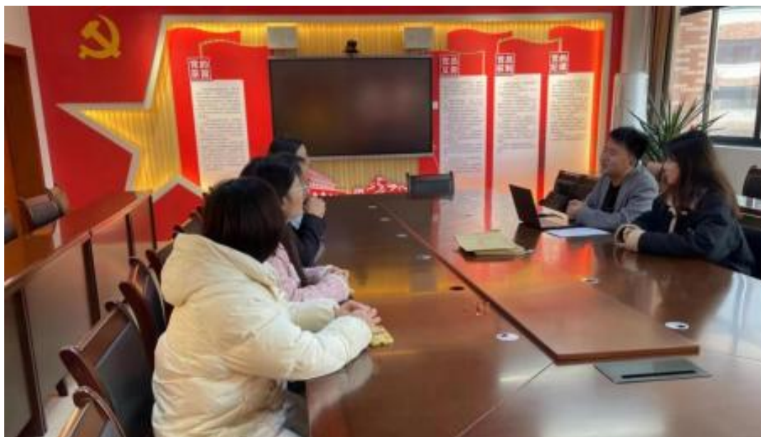
图 校企开展学术研讨项目交流会议

公 高度 队 的 ，充分 到 和 的关 ，对 高 和 关 的 。此公 供 ，包 更 、 方法 及 导 发 程，并 持 丰富 的 家 过 、 会 和 际案 ， 队 分 的 和 。 常 地 活动， 包 参加 会 、 等 ， 促 问 的 分 ， ， 并 的 队 ( )。